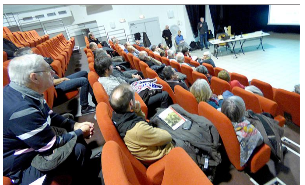
Les orientations du projet de centre-village s'articulent autour du stationnement, de la réduction des voies et des itinéraires cyclables.